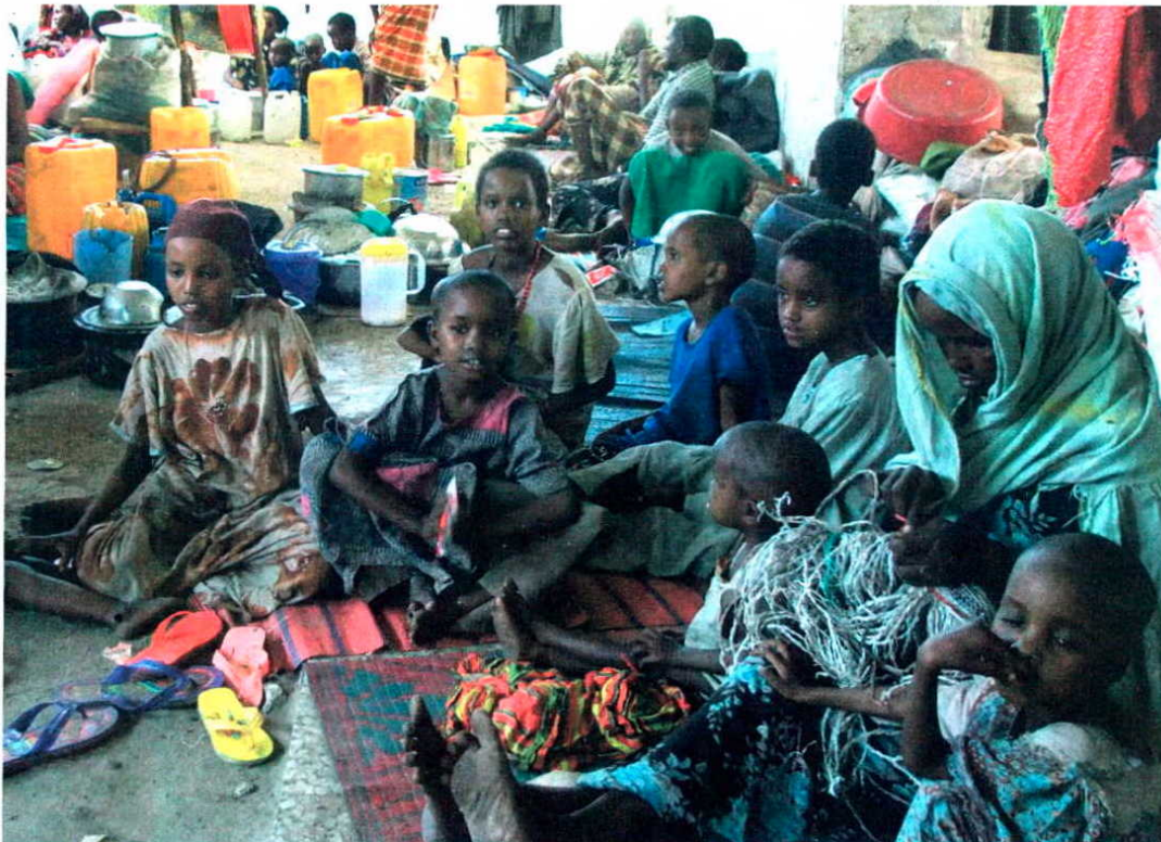
Refugiados del sur de Somalia descansan en el edificio en ruinas donde se cobijan