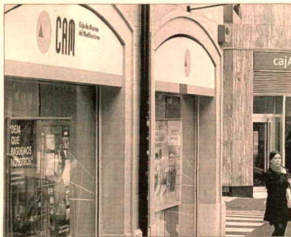
Sucursal de Caja del Mediterráneo (Oviedo).

Entre tanto, la CAM continúa con la polémica de su intervención. El partido político vecinos por Alicante (VA) y el movimiento 15-M han presentado denuncias ante la Fiscalía Anticorrupción para que investiguen la gestión realizada por los directivos de la CAM. "Pedimos que se aclaren las posibles operaciones fraudulentas y de capitales", afirman desde el 15-M.