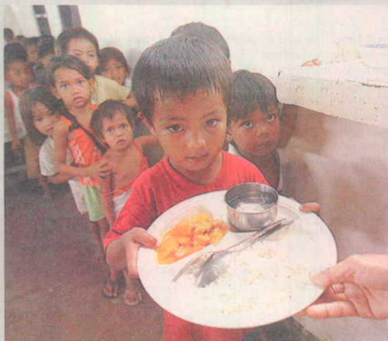
Se calcula que anualmente 125 millones de menores no tienen acceso a agua potable.

Una de las claves para romper con esta situación es la formación de las mujeres. Cada vez más proyectos de cooperación se centran en la eliminación de la desigualdad y en promover la