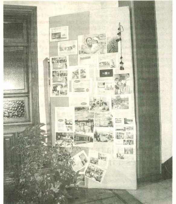
Mural con diferentes informaciones sobre el país