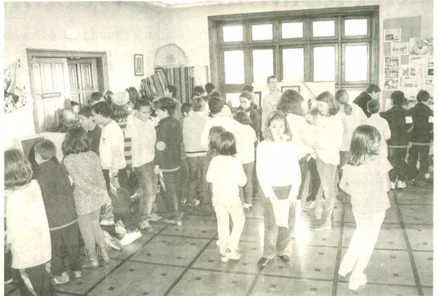
Los alumnos iniciaron los preparativos de la jornada desde hace varias semanas

La Jornada de Solidaridad se ha convertido en un elemento prioritario para el colegio Santa Teresa de León desde su nacimiento hace ya nueve años. Una comisión formada por docentes y padres del centro se encarga de apoyar las causas que persigue InteRed en todo el mundo con el fin de fomentar la interculturalidad entre los estudiantes. «A lo largo de los años hemos trabajado países de África, Asia y América del Sur como Congo, Bolivia y en esta ocasión México». Esta jornada suele prepararse con varias