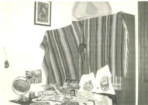
Parte de la exposición con productos típicos de México

semanas de antelación, tiempo en el que se trabaja con los alumnos las costumbres, tradiciones y raíces del país elegido, «de hecho algunos cursos profundizan en el tema durante todo el curso», señalan desde la comisión. La participación de la comunidad educativa –tanto padres, alumnos como profesores– resultó de nuevo un éxito por lo que los organizadores ya piensan en las actividades para el año próximo.