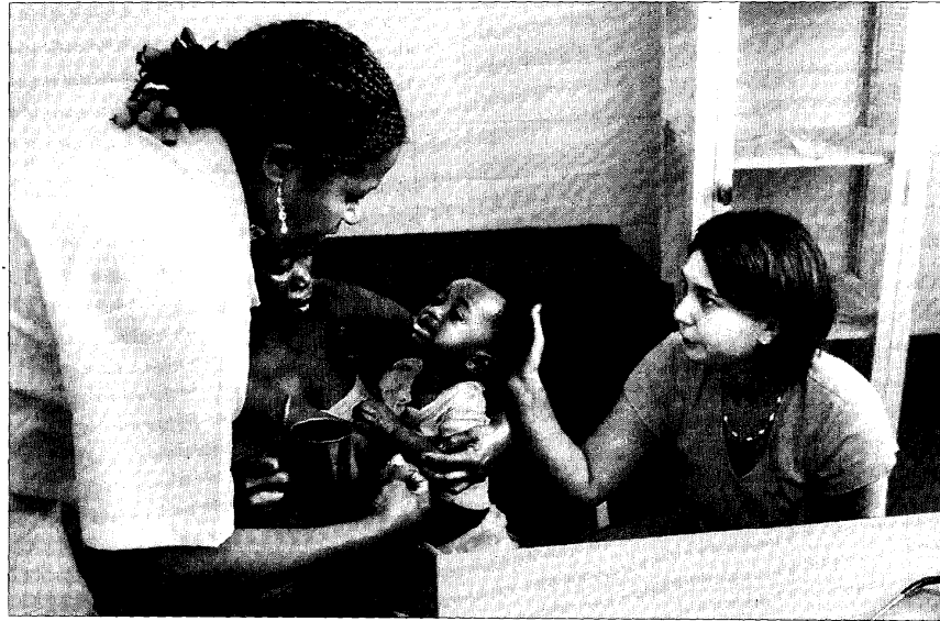
Unas enfermeras administran un tratamiento para prevenir la malaria a un niño en una clínica cercana a Maputo, en Mozambique.

El primer requisito para no fracasar es adquirir el compromiso con la comunidad. En opinión del profesor Dara Amar, del Saint John's Medical College, en India, "los investigadores deben favorecer las oportunidades de escuchar y entender las verdaderas necesidades de las comunidades en las que trabajan. Para llevar a buen puerto cualquier programa es preciso contar con el respaldo de la comunidad". Y para conocer de primera mano las necesidades reales de la población, Florence Wambugu, de la Fundación Internacional África Harvest Bio-