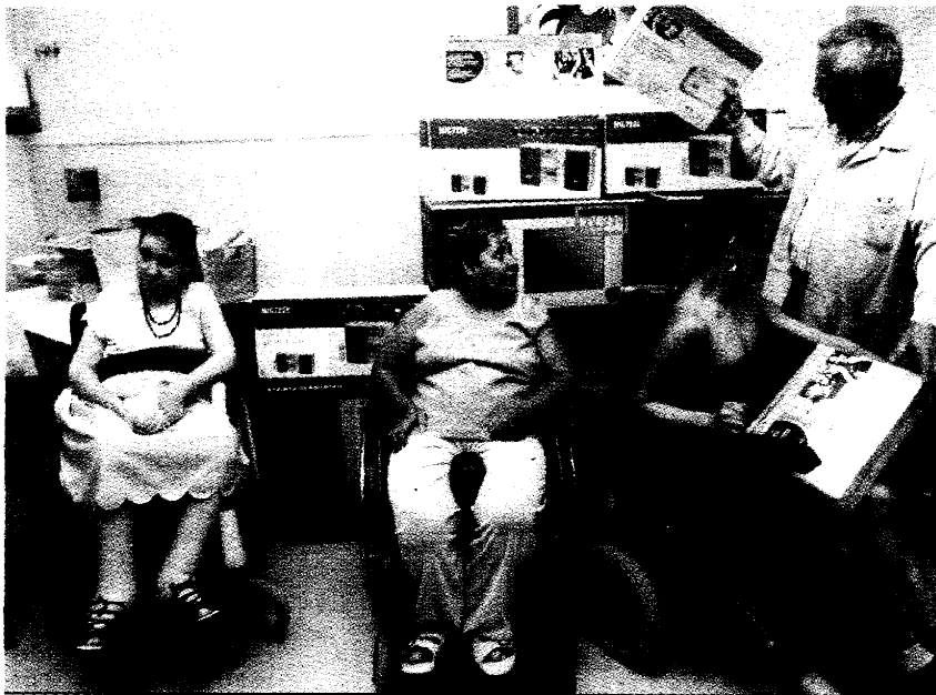
Personas con dependencia en un acto en la sede de Upace

Jiménez recordó que desde el Ayuntamiento ya se han tramitado y remitido a la Junta alrededor de 1.600 expedientes con peticiones de valoración y las correspondientes ayudas y afirmó que algunos solicitantes ya han empezado a recibir los resultados de estos exámenes. No obstante hasta que la Junta no traslade dichos informes a la dirección general de