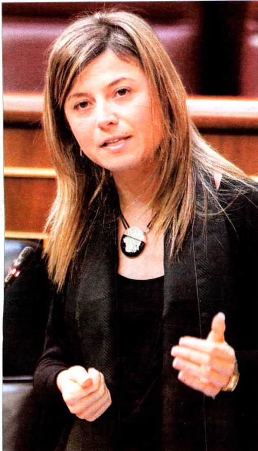
Bibiana Aído también cerrará las webs localizadoras de prostitutas

Por su parte, Carlos Salvador apoyó en el Pleno los planes de Igualdad y alabó «el posicionamiento valiente» de la ministra, aunque le pidió que tome medidas «eficaces» que de verdad acaben con los anuncios de contactos. Para ello, sugirió que el Gobierno «no inserte publicidad institucional» en los periódicos que incluyan estos anuncios.